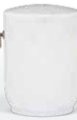
Naturstein ab Seite 163