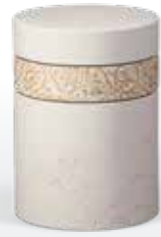
Zellulose/Terrajura ab Seite 45