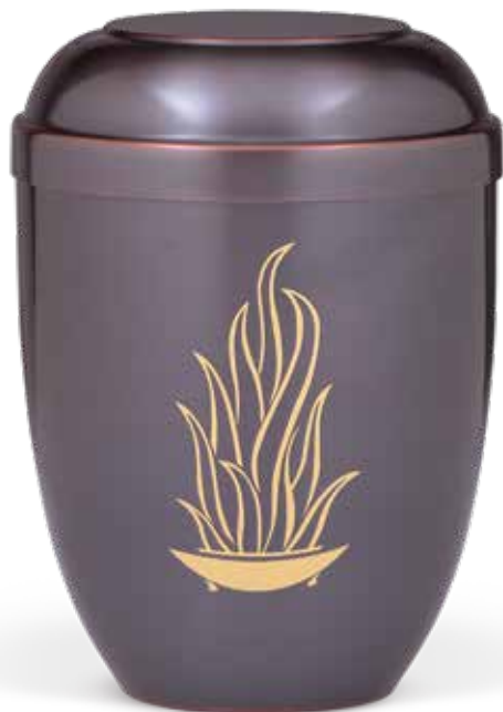
C 510-1 F