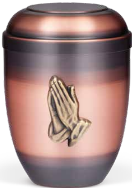
C 510-3 BH