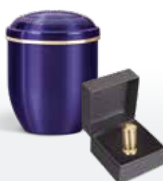
Mini-Urnen Seite 174