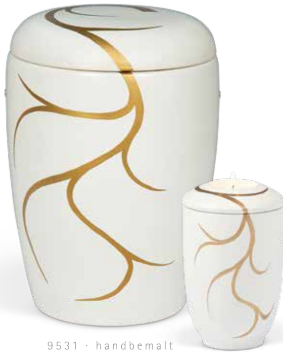
9531 · handbemalt