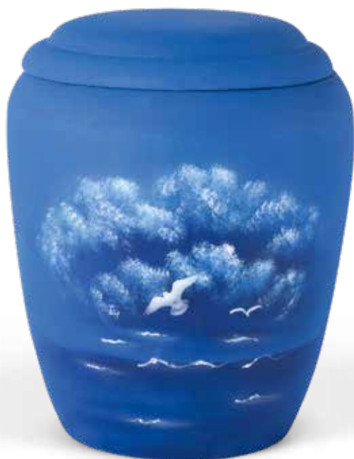
2065 · handbemalt