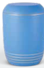
Seeurnen ab Seite 155