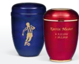
Individuelle Gestaltung/Beschriftung ab Seite 171