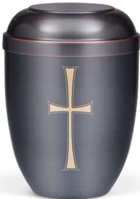
C 510-1 K