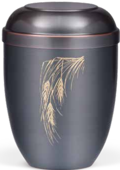
C 510-1 AE