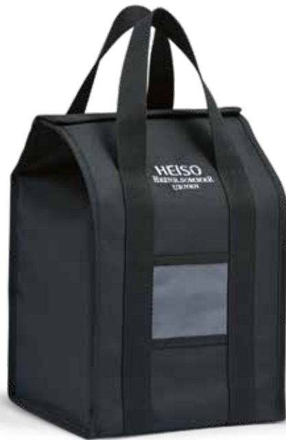
90011-L ohne Bestickung: 90011