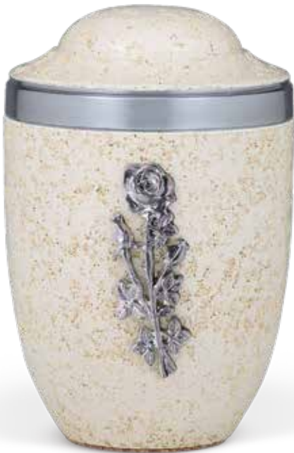
2810 RON · auch ohne Emblem lieferbar