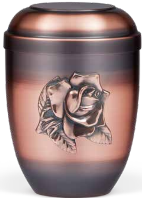
C 517-3 RO