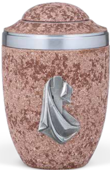
2840 KT · auch ohne Emblem lieferbar