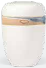
Dekorbänder ab Seite 7