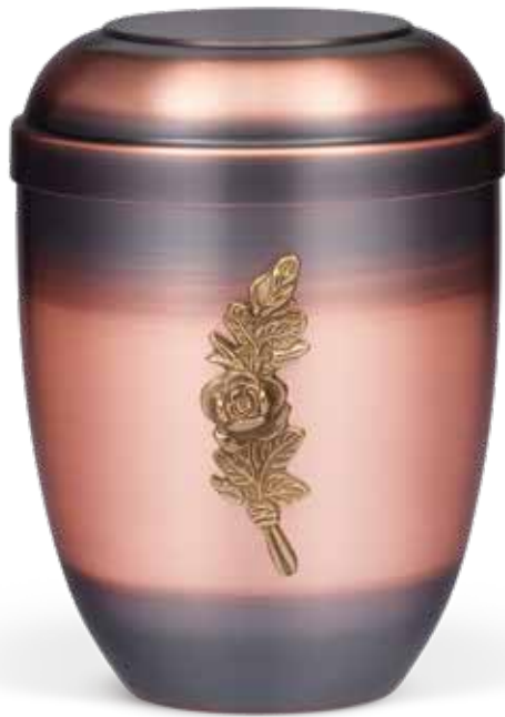
C 510-3 RO