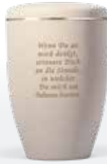
Trauertexte/Trauergedanken ab Seite 17