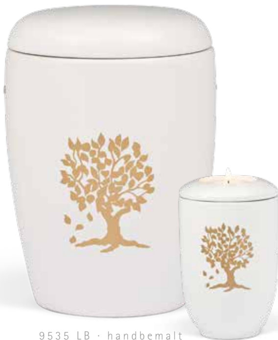
9535 LB · handbemalt