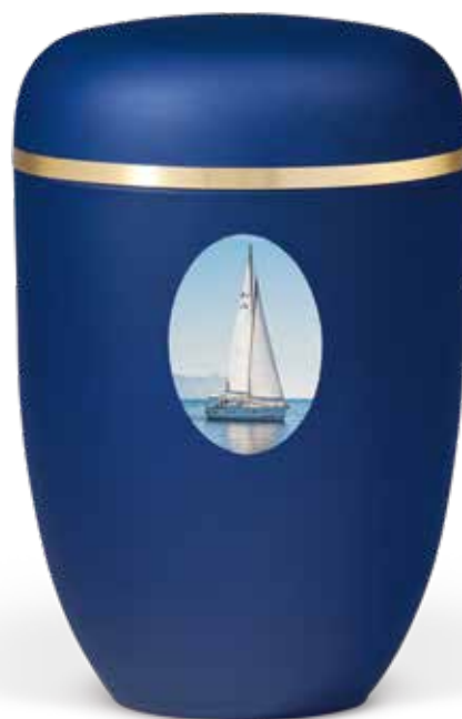
790641 · Urne 3690 GB