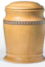
Holz ab Seite 141