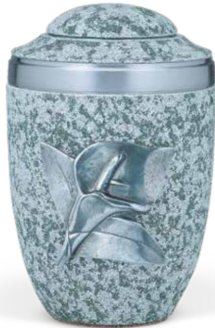
2830 CA · auch ohne Emblem lieferbar