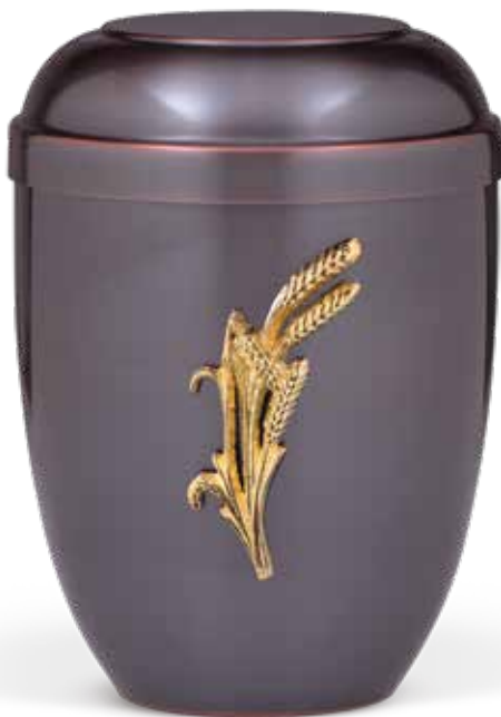
C 510-1 AEH