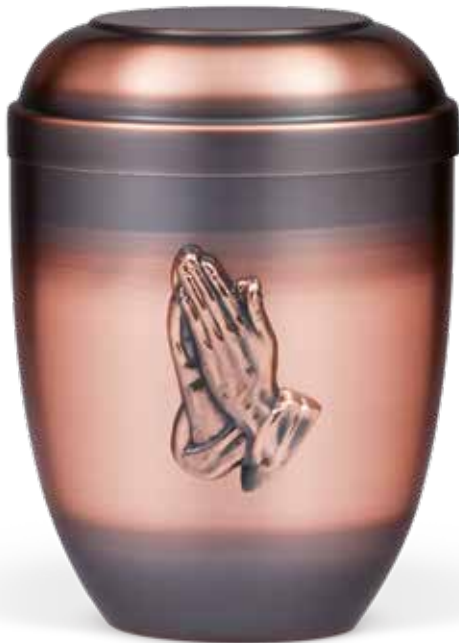
C 517-3 BH