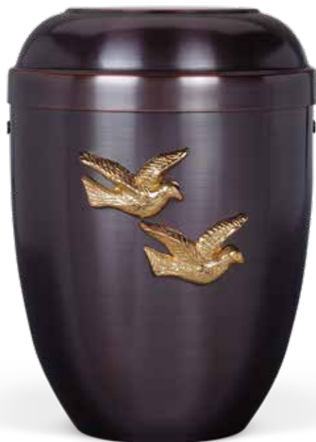
C 550-1 TAUB