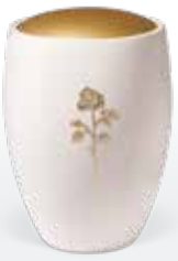
Keramik ab Seite 147