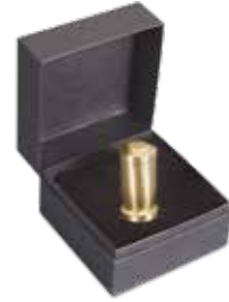
Schatulle Best.-Nr. 90008*