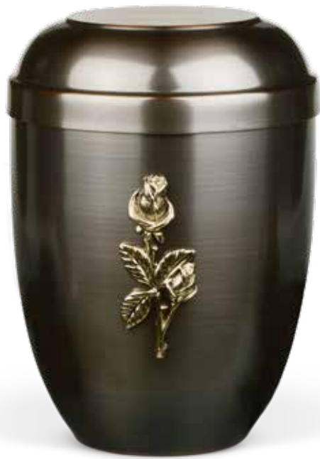
C 510-1 RO