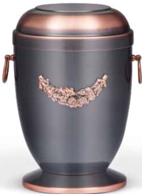
C 502-1 SG