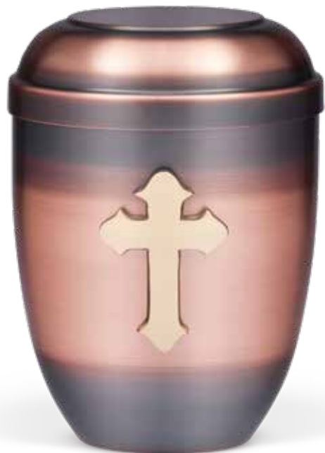
C 510-3 GK