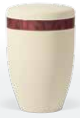
Modell „6200“ ab Seite 51