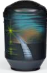
Airbrush ab Seite 27