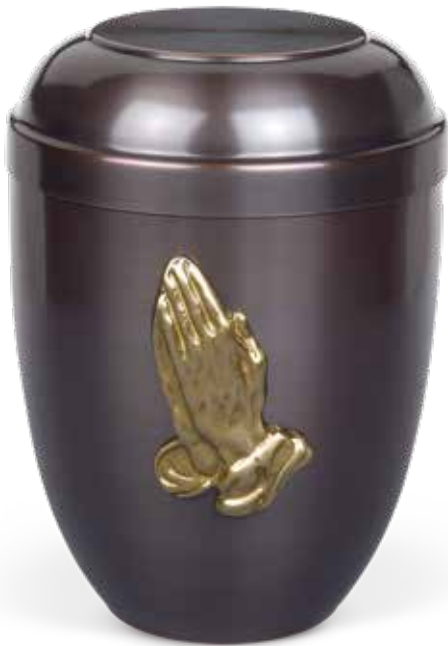
C 510-1 BH