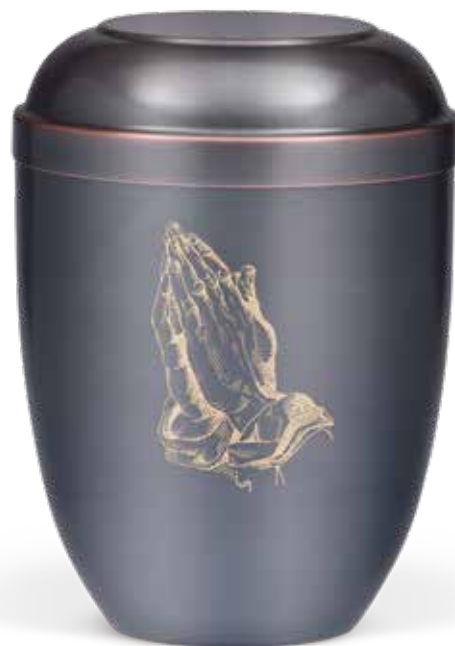
C 510-1 H