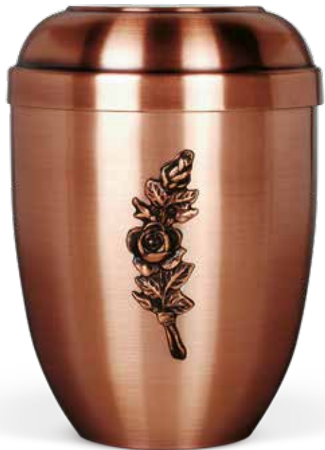
C 540 RO