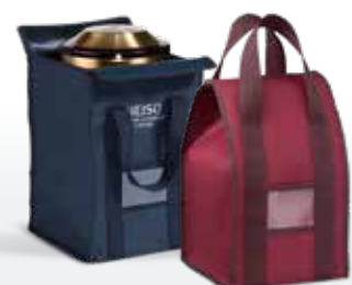
Zubehör ab Seite 175