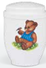
Kinder ab Seite 165