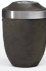
Stahl/Terrajura u. Steinbeschichtung ab Seite 63