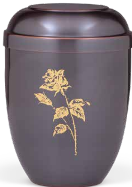
C 510-1 R