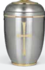
Metallurnen/Klassisch ab Seite 69