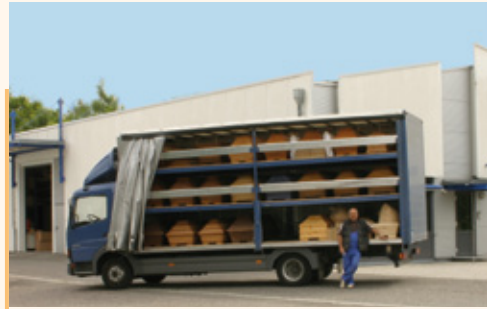
Eigener spezieller Lieferservice

Auch in der vierten Generation ist das Unternehmen den Grundsätzen des Firmengründers treu geblieben: Qualität und optimale Kundenbetreuung.